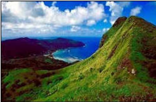
Rurutu ,l'île des Baleines à Bosse