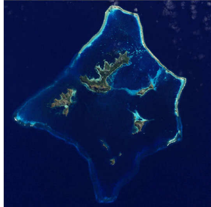
Plusieurs îles hautes dans une seule Lagon ! C'est les Gambiers!!!