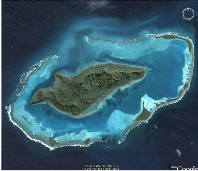
Raivavae: la perle du pacifique !